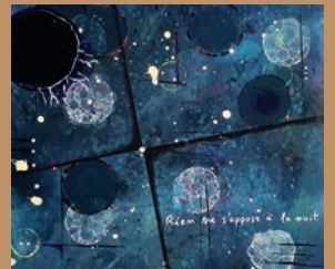
JOËL BOUTTEVILLE (77)